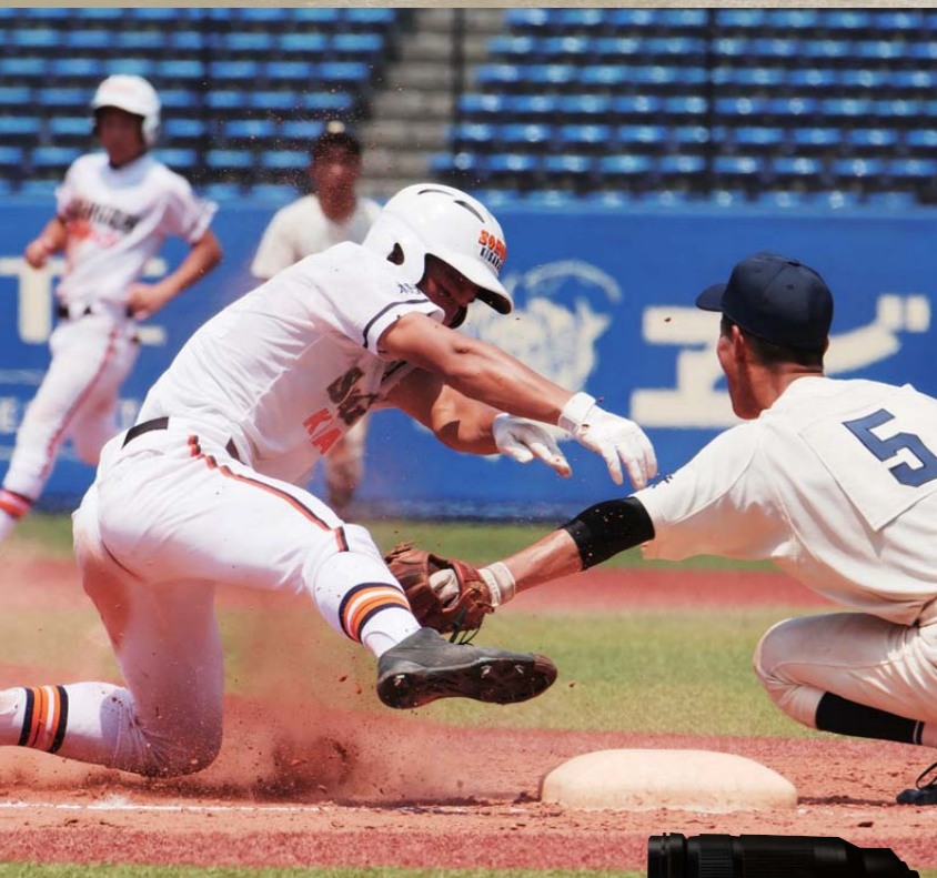
LEICA DG VARIO-ELMARIT 50-200mm / F2.8-4.0 ASPH. / POWER O.I.S.