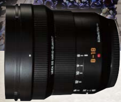
LEICA DG VARIO-ELMARIT 8-18mm / F2.8-4.0 ASPH.